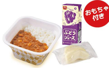
お子様カレーセット 450円