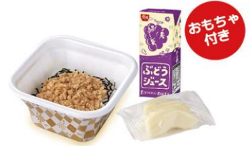
お子様とりそぼろ丼セット 450円