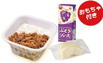
お子様牛丼セット 450円